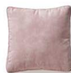
Cojín / coussin / cushion 50x50 C03