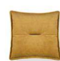
Cojín / coussin / cushion 45x45 C17