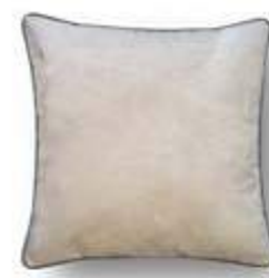
Cojín / coussin / cushion 45x45 C05