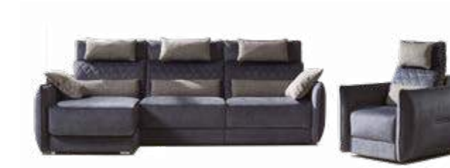
ADAM sofá Relax eléctrico | fijo. ADAM sillón Relax eléctrico | fijo.

Adam, un exclusivo Relax , elegante y de marcados detalles que lo diferencian y lo hacen especialmente atractivo .