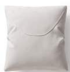
Cojín / coussin / cushion 45x50 C02