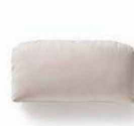
Cojín / coussin / cushion 50x25 C08