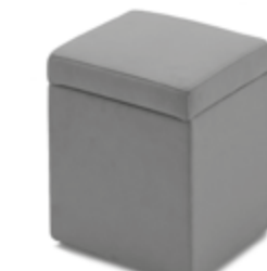
Pouf arcón / pouf coffre / chest pouf 35x35x45 PA35