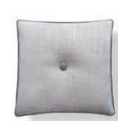
Cojín / coussin / cushion 45x45 C16