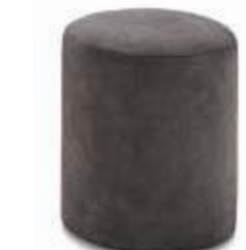
Pouf fijo / pouf fixe / fixed pouf 35x45 PRF35