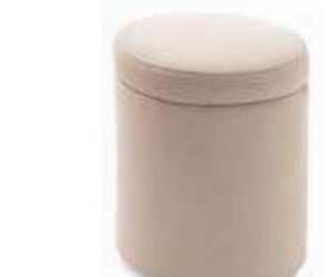
Pouf arcón / pouf coffre / chest pouf 35x45 PRA35