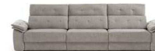
KIM deslizante Forte eléctrico.

MEDIDAS alto | ancho | fondo sofá | fondo Ch. 109 | 356 | 105 / 160 | 150 / 186