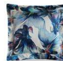
Cojín / coussin / cushion 53x53 65x65 C09 C10