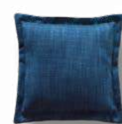
Cojín / coussin / cushion 48x48 C15