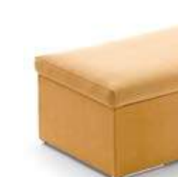
Pouf vestidor / pouf vestiaire / dresser pouf 120x55x50 PAV