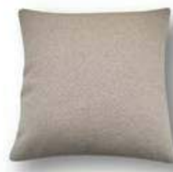
Cojín / coussin / cushion 45x45 C04