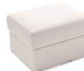
Pouf arcón / pouf coffre / chest pouf 80x70x45 PA80