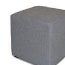
Pouf fijo / pouf fixe / fixed pouf 45x45x42 PF45