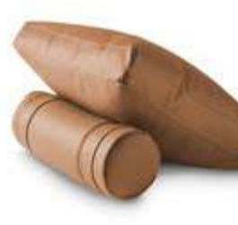
Cojín / coussin / cushion 50x50 / 15 \varnothing C13