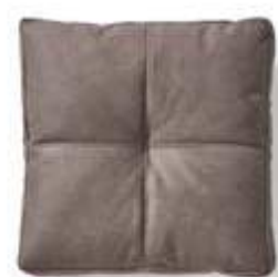
Cojín / coussin / cushion 50x45 C01