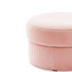
Pouf arcón / pouf coffre / chest pouf 70x45 PRA70