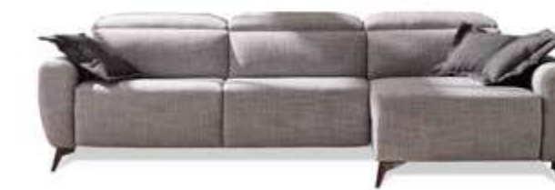
GENIO Relax eléctrico | fijo.

CON SUS COJINES Y SUS FUNDAS CUBREBRAZOS PODRÁS CREAR TU PROPIO DISEÑO.