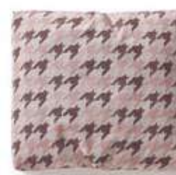
Cojín / coussin / cushion 50x45 C07