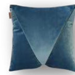
Cojín / coussin / cushion 50x50 55x65 C11 C12