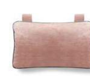
Cojín cabecera sillón con vivos / C. têteière fauteuil avec passepoils / Headrest pillow armchair with trims - 40x25 C19