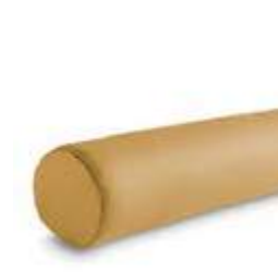
Cojín / coussin / cushion 15 / 50 \varnothing C14