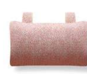
Cojín cabecera sillón / coussin têteière fauteuil / headrest pillow armchair 40x25 C18