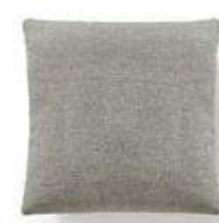
Cojín / coussin / cushion 40x40 C06